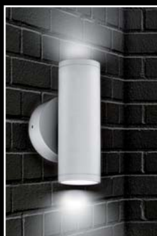
SOLNA 20 watts éclairage «up & down» 36°