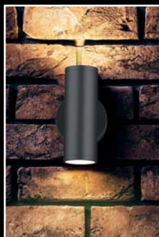
SOLNA 10 watts éclairage «up & down» 15°